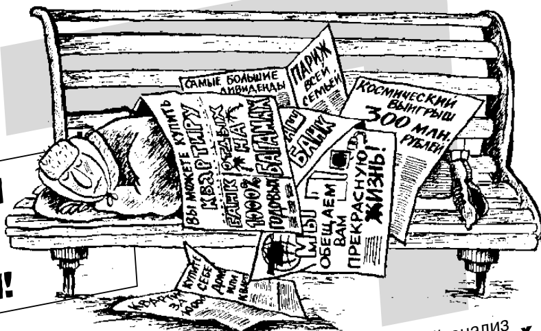
РИС. Л. МЕЛЬНИКА (С-ПБ)

Любезные Читатели журнала! В тяжкую годину кризиса, во время горестных раздумий о том куда катится мир и где занять денег, чтобы отдать денег, редакция «КБ» с оптимизмом смотрит в будущее и ищет новое смешное, не отрываясь при этом от своих корней. Сегодня мы вытаскиваем на свет наши корни с глубины 2000-2003 годов и предлагаем вашему вниманию крепкие, упругие и жилистые тексты, которые, как нам кажется, совсем не устарели!