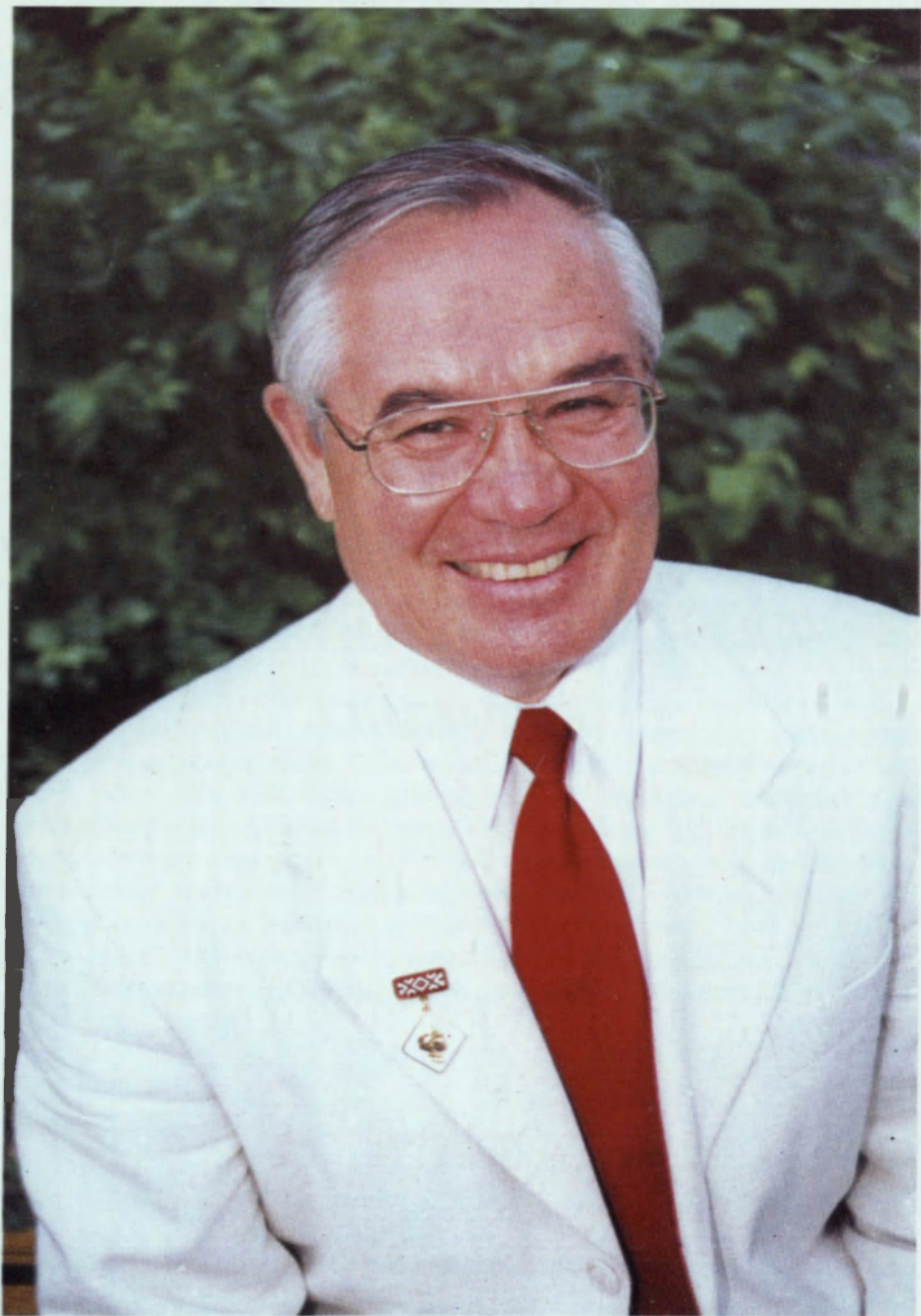
Ректор Чувашского госуниверситета Л.П. Кураков