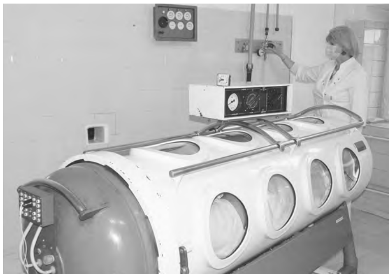
Воронежские медики используют барокамеры, построенные на местном Механическом заводе.

— Сложность работы с COVID-больными в том, что вместе с коронавирусом нам приходится лечить их прежние заболевания: сердечно-сосудистые, сахарный диабет, гематологию. Есть пациенты после инфарктов и инсультов. Надо выдавать массу разных лекарств, среди них много незвестных и новых.