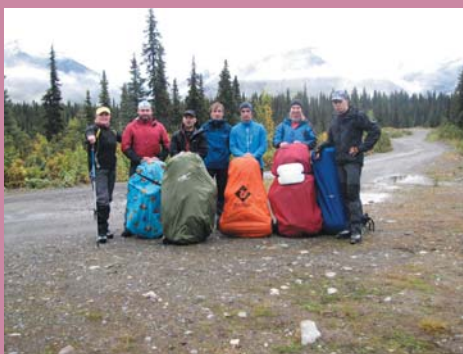
Ф2. Начало маршрута