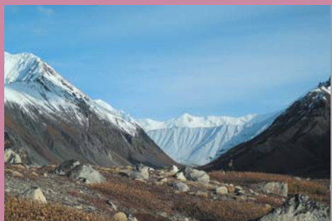
Ф7. Последний перевал