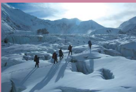
Ф5. На леднике