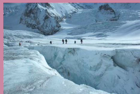
Ф6. На леднике