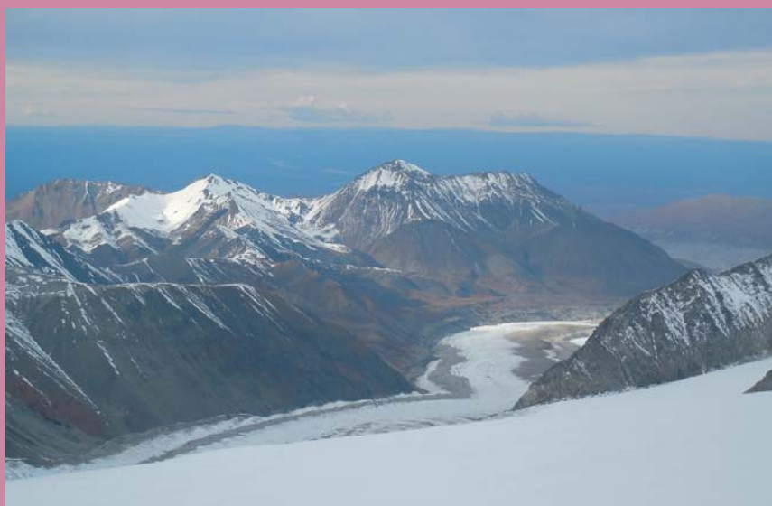
Ф10. Аляска сверху