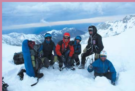
Ф8. Группа на перевале