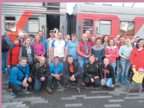
Ф1. Отъезд группы