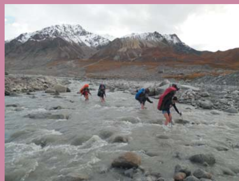
Ф3. На переправе