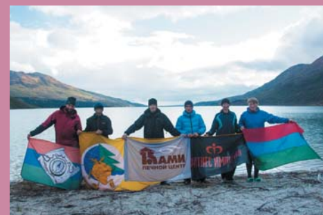
Ф9. У озера - конец маршрута