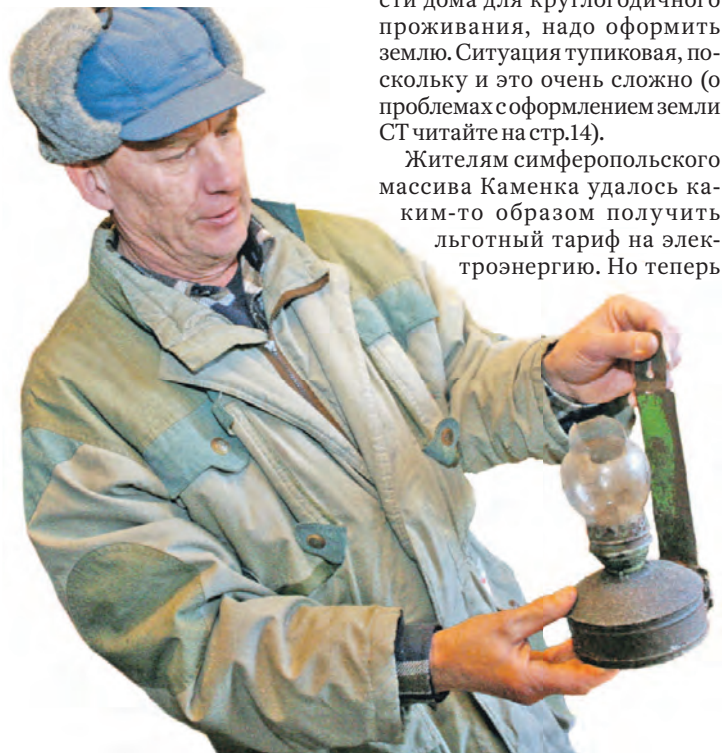
Чтобы сэкономить на электроэнергии, некоторые садоводы используют керосиновые лампы.