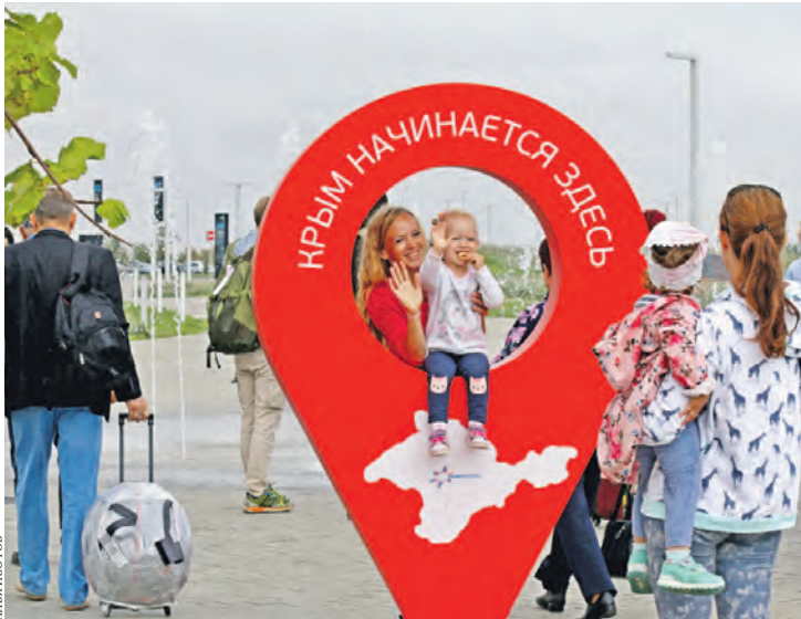
За полгода новый терминал аэропорта обслужил 3,8 миллиона пассажиров.