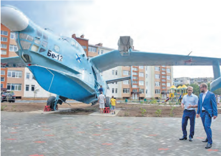
Самолет Бе-12 стал главным экспонатом нового сквера.