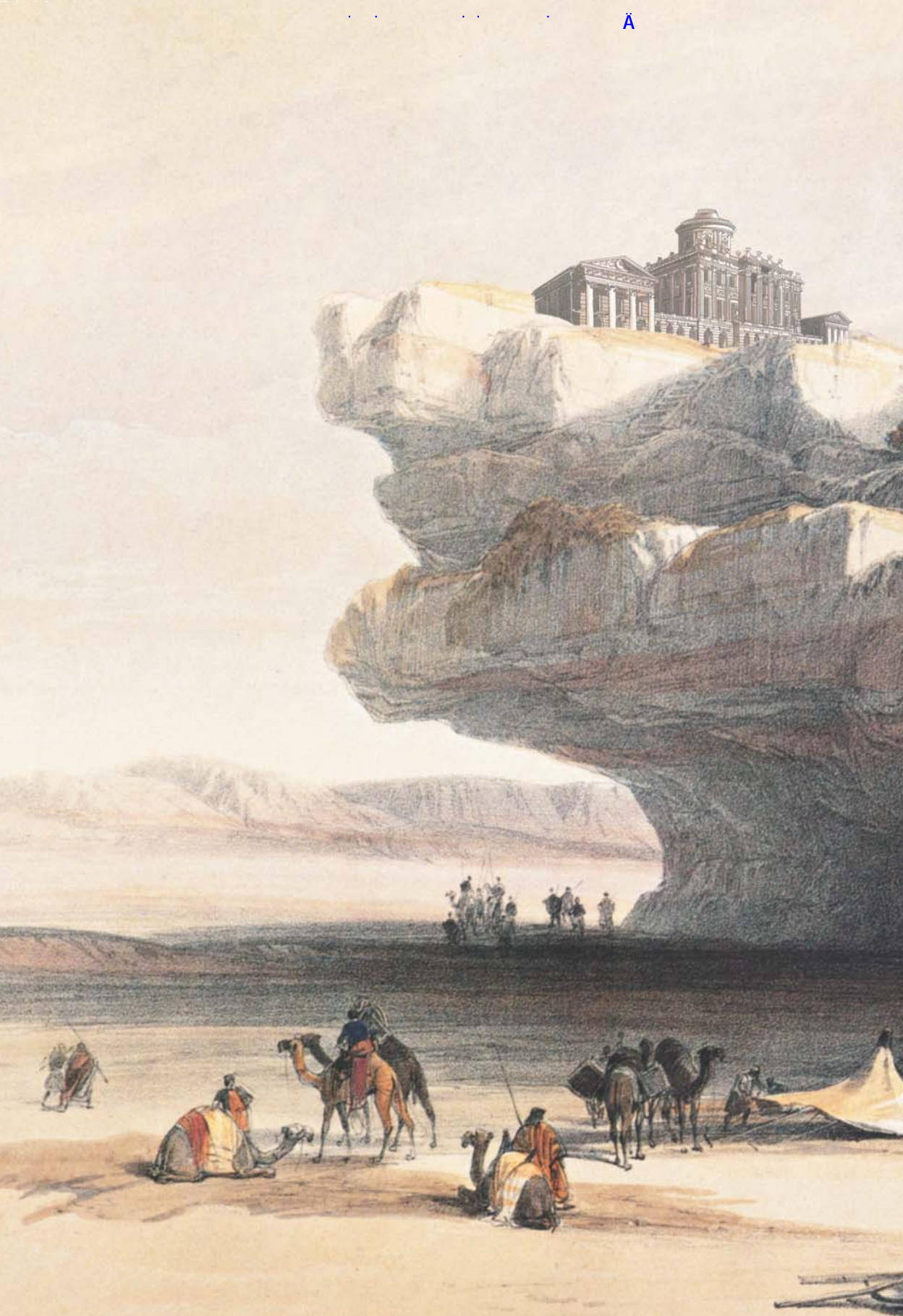
Approach to PETRA - An Ancient Way