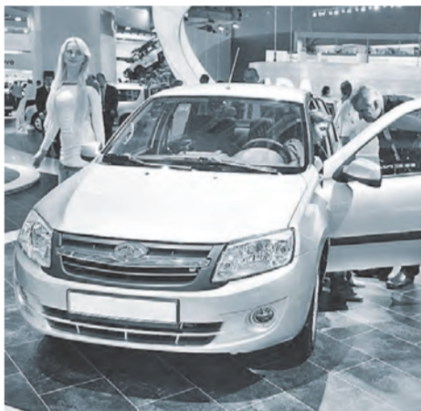
Льготы распространяются на автомобили, произведенные в 2015 г.