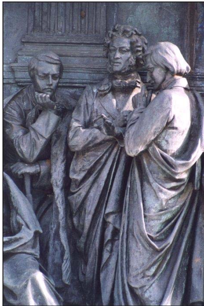
Великий Новгород. Кремль. Лермонтов, Пушкин и Гоголь Фрагмент памятника к 1000-летию России

• Андроников И. Л. Гоголь и его современники / Ираклий Андроников // Великая эстафета : воспоминания, беседы / оформ. А. Ганнушкина. – 3-е изд. – М. : Дет. литература, 1988. – 335 с. : фотоил.