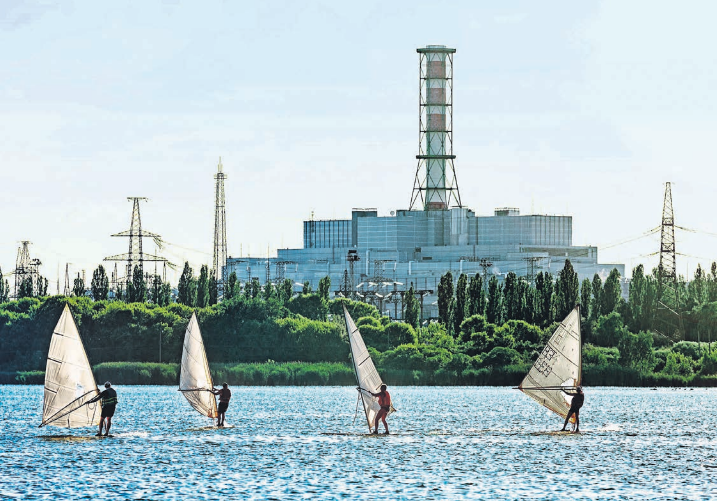
Украинский беспилотник взорвался или был сбит в нескольких километрах от Курской атомной электростанции

Оценку инциденту дали и в МИДе. «В городе Курчатове, где находится Курская АЭС, упал украинский дрон. Те страны, которые их поставляют киевскому режиму, планируют отселиться на Марс, если произойдет ядерная катастрофа? Не успеют,— написала в своем Telegram-канале официальный представитель ведомства Мария Захарова.— Да и звездолетов, например, у некоей державы Британии своих нет. Не говоря уже об абсолютном большинстве стран НАТО». По ее словам, «народы натовских стран должны понимать, что их правительства спонсируют ядерный терроризм в исполнении киевского режима». Дипломат не уточнила, какая именно страна могла поставить Украине долетевший до Курчатова беспилотник.