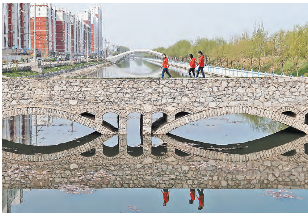
Арочные мосты под старину органично вписались в панораму уезда Аньсинь в Новом районе Сюань.