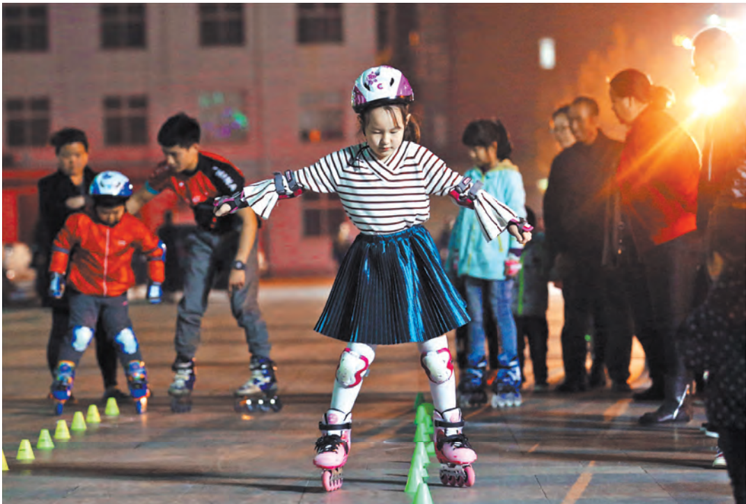
Дети катаются на роликах в уезде Аньсинь в Новом районе Сюань.