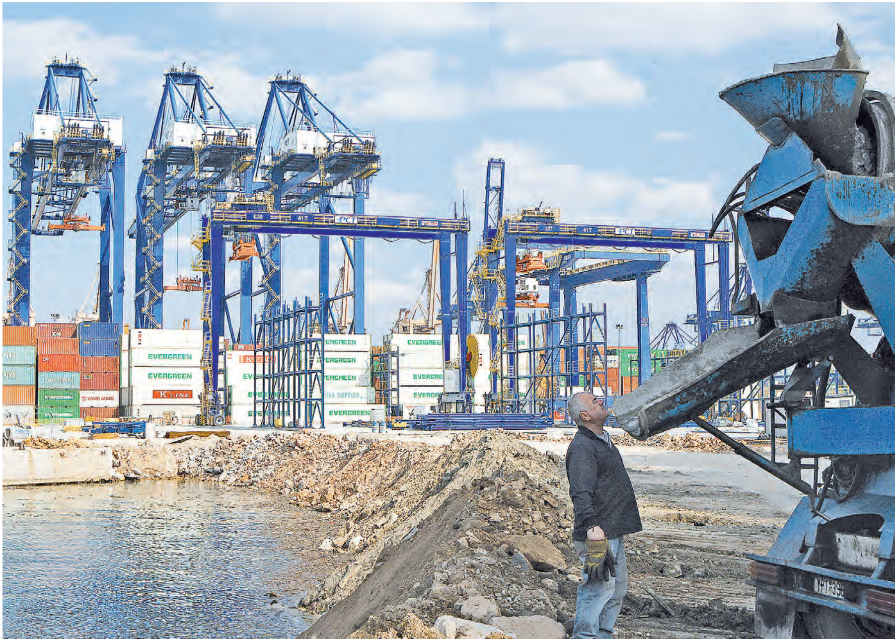
Афинский порт Пирей, его строительство проинвестировала китайская компания COSCO. Китай вложил около 50 миллиардов долларов в инфраструктурные проекты экономического пояса.

Си Цзиньпин ясно изложил свои амбиции в отношении инициативы «Один пояс — один путь»