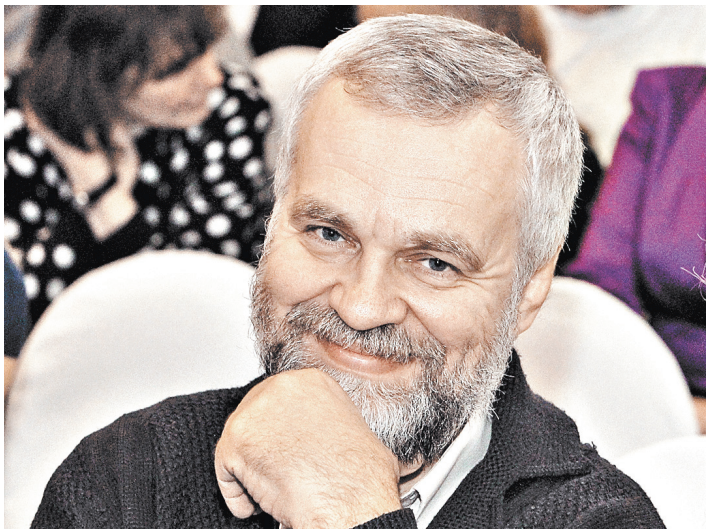
Алексей Варламов: Писатель — это человек, который был чем-то стукнут.

АНОНС / Гость «СОЮЗа» — народный артист СССР Юрий Соломин Его превосходительство