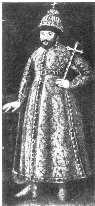
Царь Михаилъ Теодоровичъ (Съ древняго портрета)