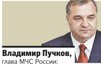
Владимир Пучков, глава МЧС России:

СОВЕЩАНИЕ на тему «Экологическое образование для Беларуси, России и Украины» прошло в Белорусском государственном университете. Участники встречи ознакомились с проектами и предложениями по формированию экологических знаний с помощью дистанционного обучения, а также с организацией взаимодействия в области образования и науки. Беларусь на совещании была представлена специалистами семи учреждений высшего образования.