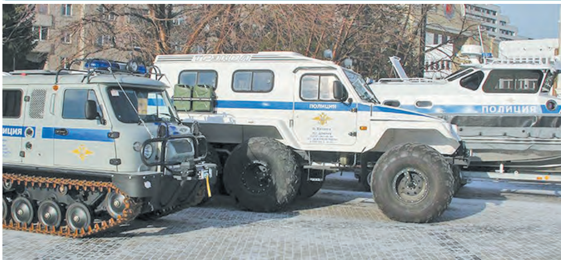
ГУ МВД РОССИИ ПО КРАСНОЯРСКОМУ КРАЮ

Красноярские полицейские получили новую технику, в том числе 12 внедорожников «УАЗ-Патриот». Патрульные машины оснащены средствами фиксации обстановки внутри и снаружи, радиостанциями, громкоговорителями, в комплекте есть также специальное медицинское оборудование, чтобы оказывать пострадавшим первую помощь. Кроме того, стражи правопорядка получили три снегоболотохода и катер.