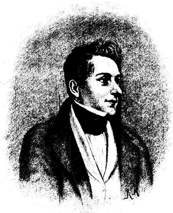
Николай Васильевичъ ГОГОЛЬ.

Доволено цензурою. С.-Петербургъ, 23 Апрѣля 1898 г.