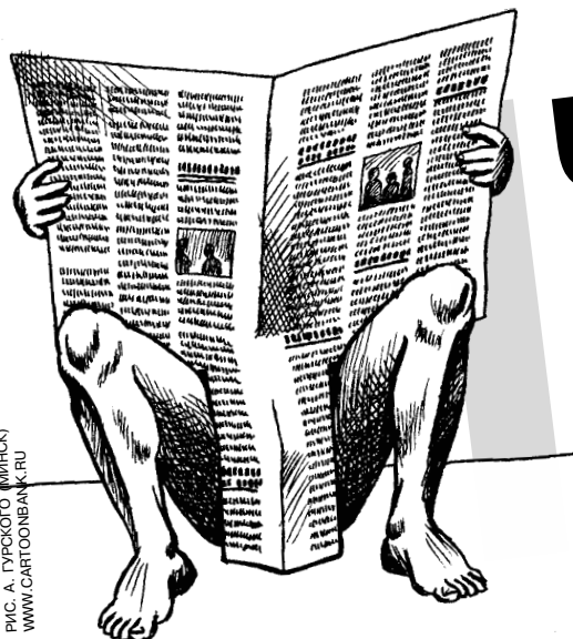
РИС. А. ГУРСКОГО (МИНСК) WWW.CARTOONBANK.RU

Президент призвал заботиться о маленьких гражданах!