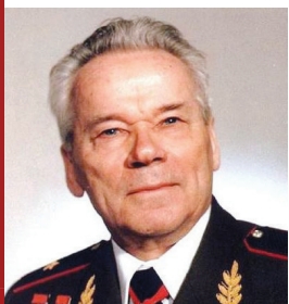
Михаил КАЛАШНИКОВ Конструктор (Удмуртская Республика)