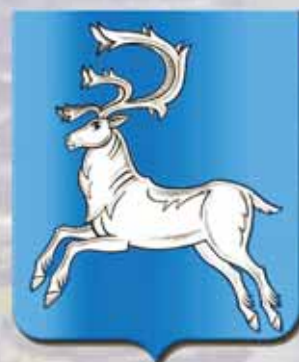
Герб города Вилюйска