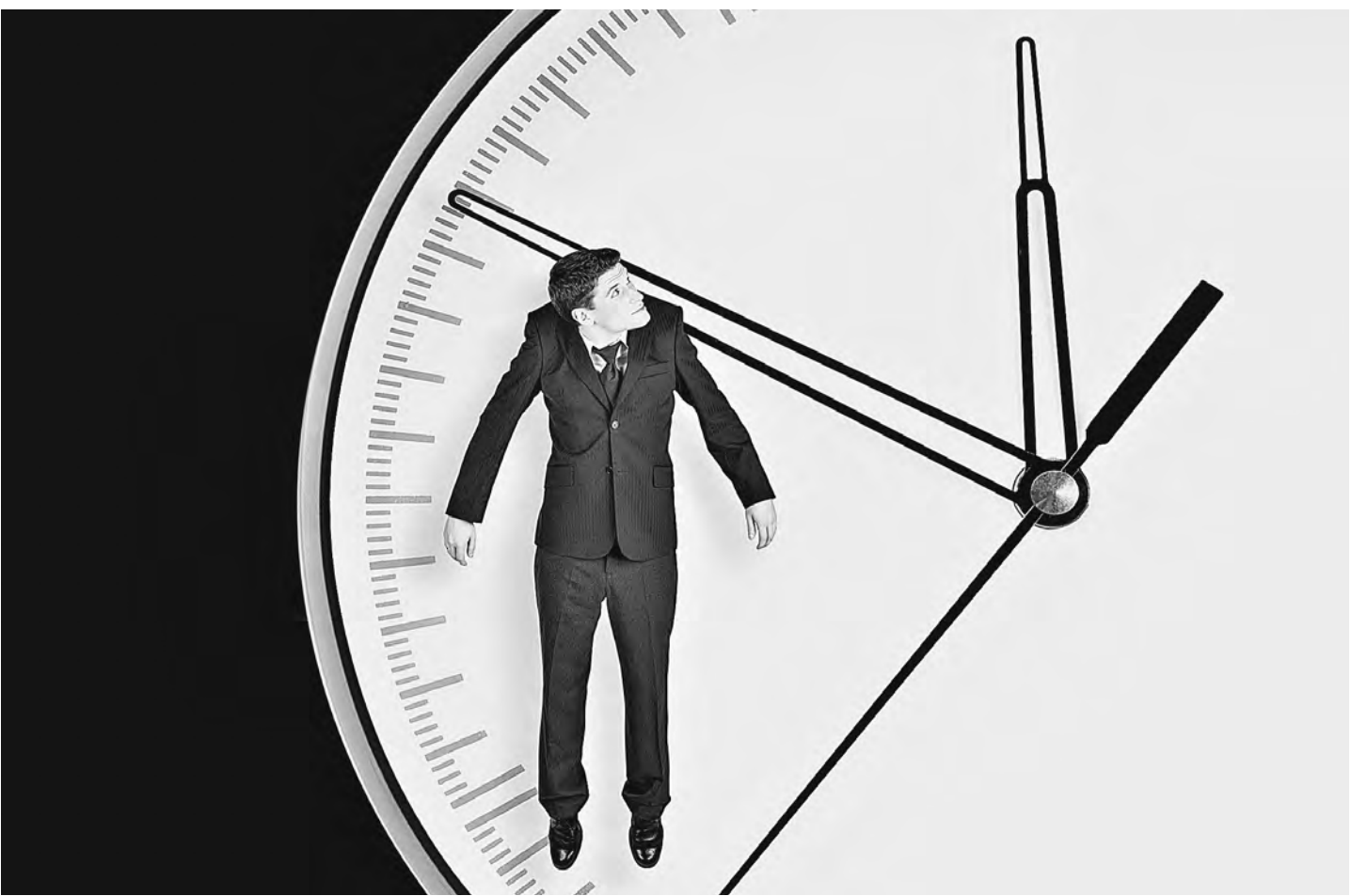
Терять время тем, кто остался без работы, эксперты не советуют. Лучше пройти профессиональное обучение и получить дополнительное образование.