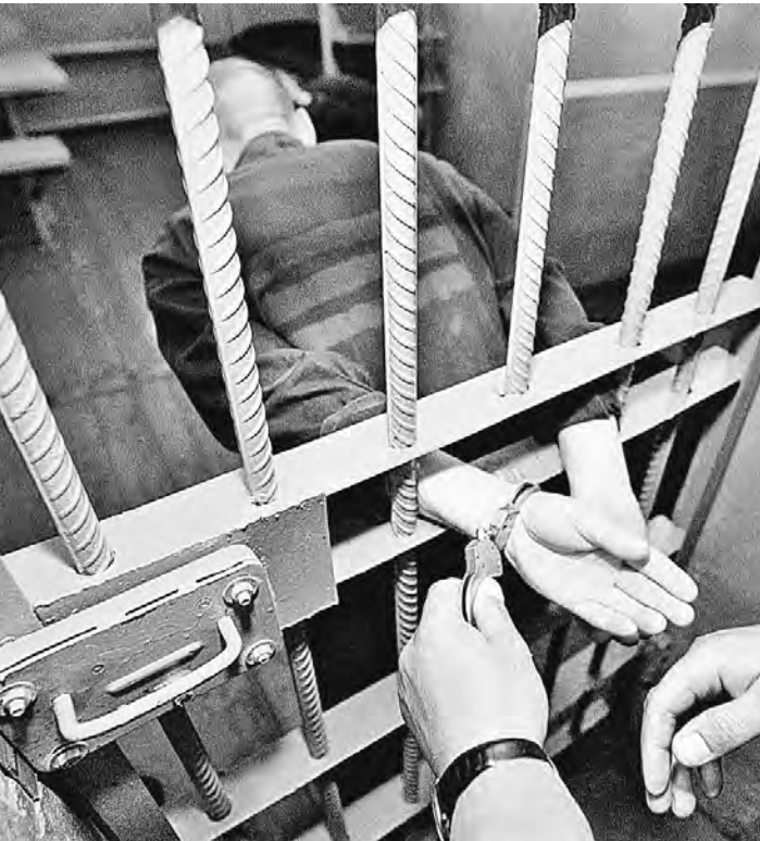
Свои проекты об амнистии готовят сразу несколько думских фракций.

Иван Петров Десятки тысяч заключенных в колониях и тюрьмах по всей стране с нетерпением ожидают предстоящий 70-летний юбилей Победы в Великой Отечественной войне. И не только потому, что это величайший праздник, но и потому, что они надеются освободиться раньше назначенного срока. Как выяснила «Российская газета», сразу несколько думских фракций уже готовят свои проекты амнистии. Свои предложения главе государства вскоре представит и Совет при президенте РФ по развитию гражданского общества и правам человека. Согласно Конституции объявление амнистии относится к ведению депутатов Госдумы. Напомним, к 65-летию Победы в 2010 году были подготовлены три варианта амнистии. Парламентское большинство в итоге остановило свой выбор на документе, вышедшем «из-под пера» председателя Комитета Госдумы по гражданскому, уголовному, арбитражному и процессуально-