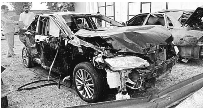
Свой автомобиль братья обнаружили на стоянке, куда от АЗС эвакуировали все машины.