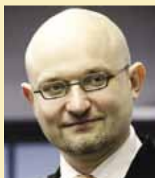
5 мая Антипова Константина Валерьевича, ректора Московского государственного университета печати имени Ивана Федорова