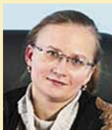
14 мая Ларину Екатерину Геннадьевну, директора Департамента государственной политики в области СМИ