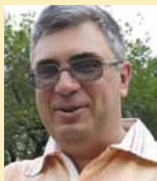
13 мая Злотникова Романа Валерьевича, русского писателя, работающего в жанре научной фантастики и фэнтези