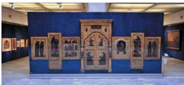
Экспозиция выставки. Пермский иконостас.