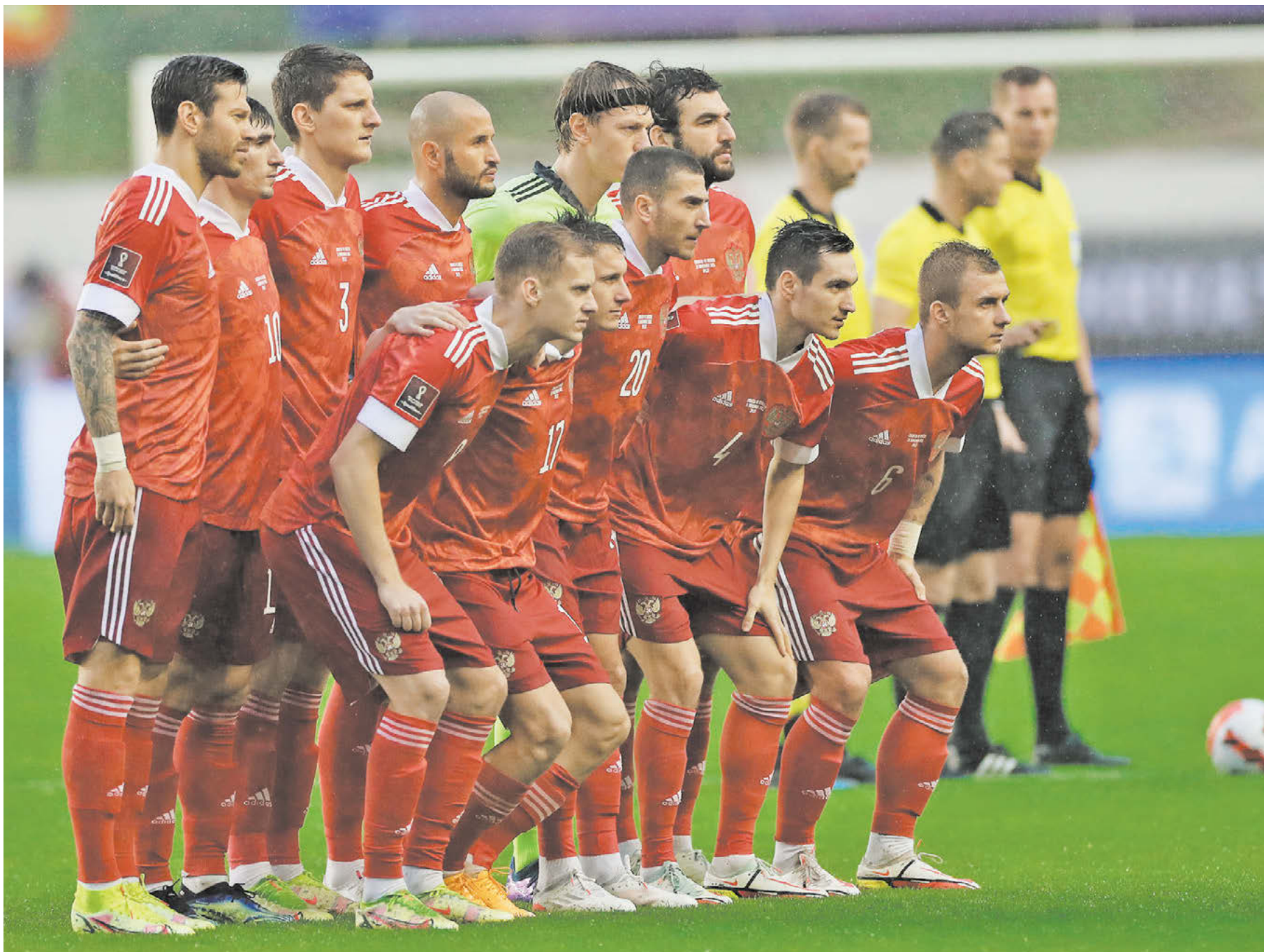
14 ноября 2021 года. Сплит. Отборочный матч ЧМ-2022. Хорватия – Россия – 1:0. Пока последняя игра нашей сборной в официальных соревнованиях

Обстоятельный разговор с генеральным секретарем РФС