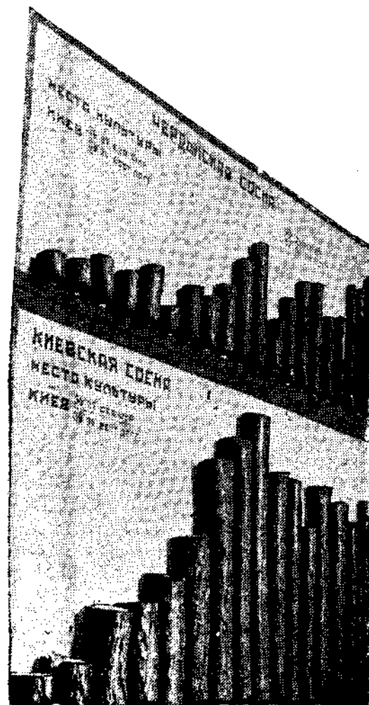
Рис. № 1. (Выше)—Ход роста культуры Чердынской сосны возле г. Киева. (Ниже)—Ход роста культуры Киевской сосны возле г. Киева.

стрируется на рисунке № 1. На нем представлена Чердынская и Киевская сосны в виде графиков, построенных годовыми приростами сосен этих рас при их культивировании в борах возле г. Киева. В наших лесокультурных проектировках может стоять вопрос о том, чтобы