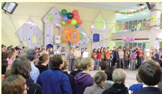
Нам 30 лет