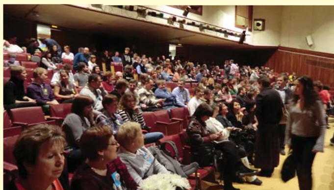
Члены клуба в зрительном зале