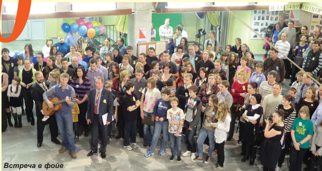
Встреча в фойе

лет детско-юношескому туристскому клубу "Следопыт — Гадкий утёнок" (г. Москва)