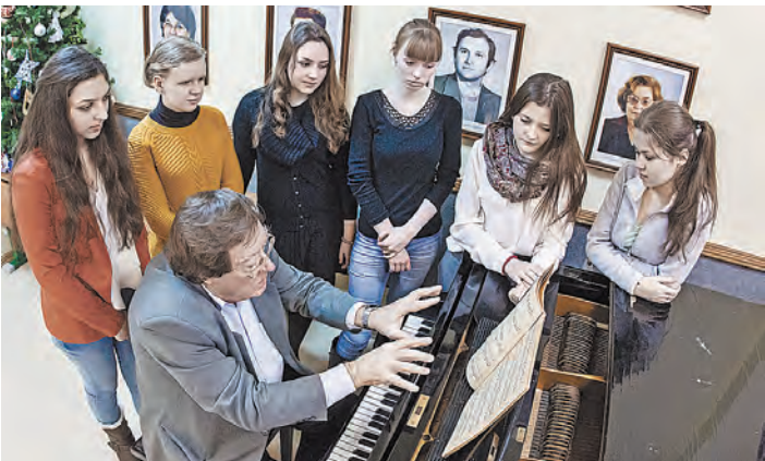
ЦМШ — единая кровеносная система: дети — родители — педагоги.

Какая, скажите, школа в России открыта для детей с половины седьмого утра, а закрывается за полчаса до полуночи? Приходи в любое время, занимай репетиционный класс и слушай Е. Велетчину Музыке.