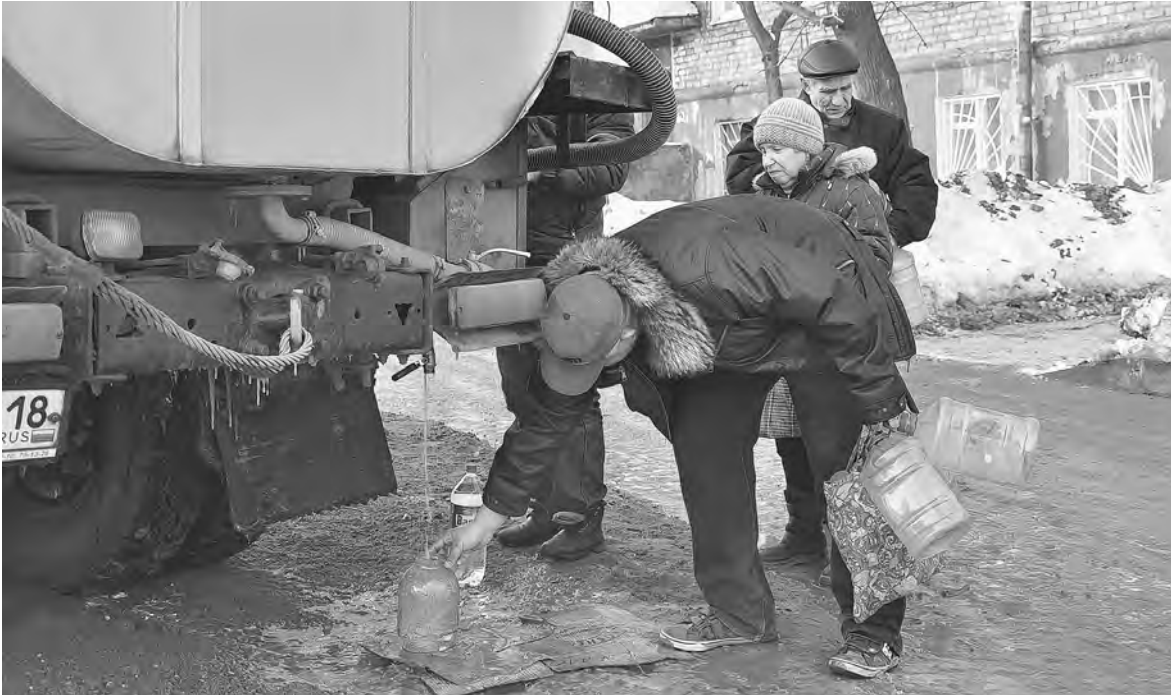
АЛЕКСАНДР ИСУПОВ / РИА НОВОСТИ