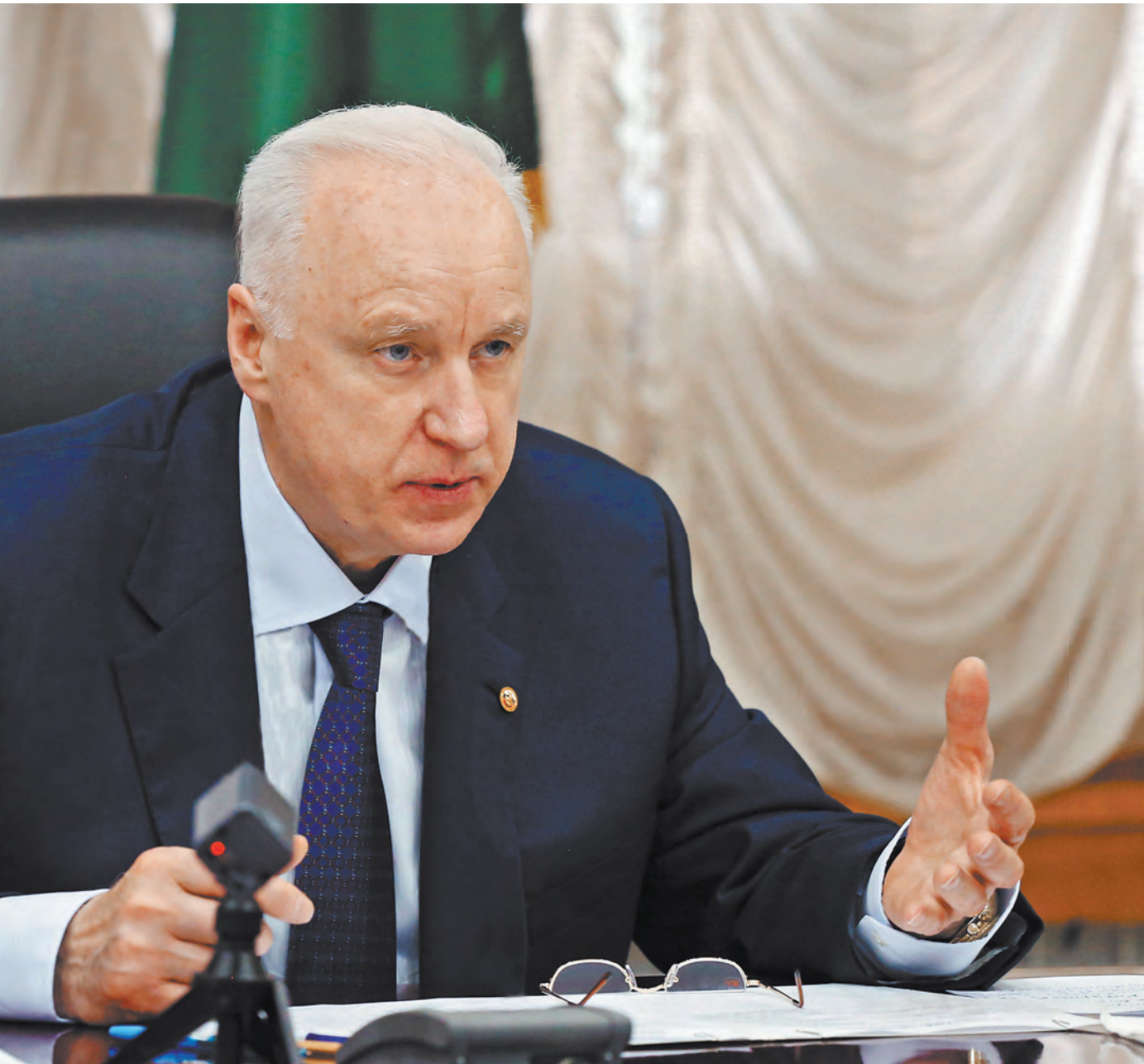
СЛЕДСТВЕННЫЙ КОМИТЕТ РФ

АЛЕКСАНДР БАСТРЫКИН: Это, конечно, в первую очередь связано с тем, что медики каждый день рискуют собственным здоровьем. Однако странно представить, как, находясь в постоянном стрессе и оказывая помощь заболевшим, им нужно думать еще и о защите своих прав в части начисления положенных выплат. Медицинские работники оказались фактически заложниками ситуации: они были вынуждены задействовать практически все каналы связи — общались через СМИ и социальные сети, по телефону доверия, через интернет-приемную, на личных приемах.