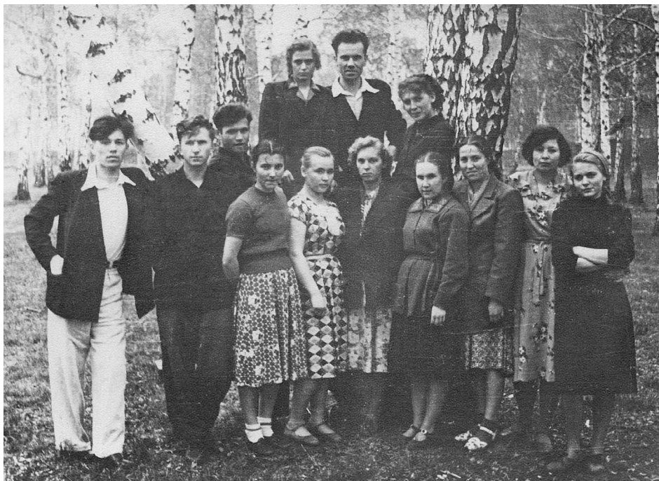
Группа студенческой молодости нашей