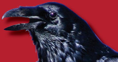
ОБЛОЖКА: СЕРГЕЙ ЖЕГЛО