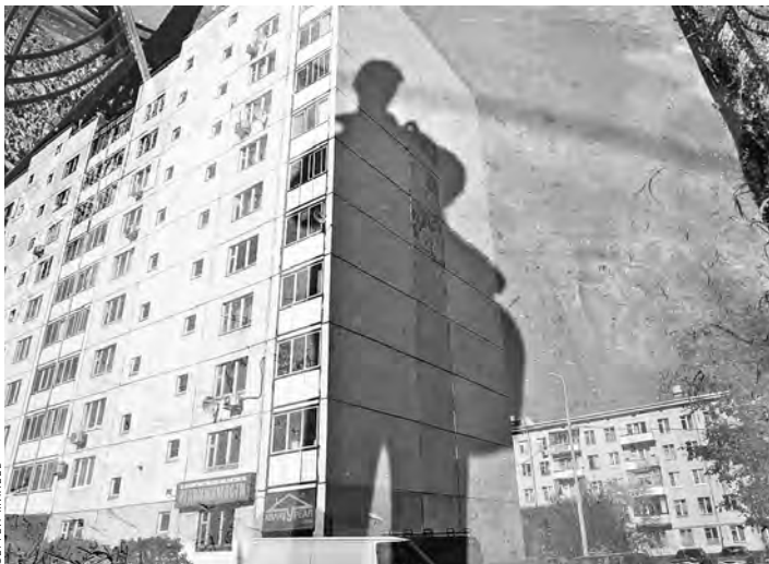
Новый закон обяжет коллекторов выйти из тени и работать по правилам.

Если коллектор просто вышел за рамки приличий — оскорблял должников, позорил их перед соседями и прочее — ему будет грозить до четырех лет лишения свободы. Когда коллекторы действовали организованной стаей или