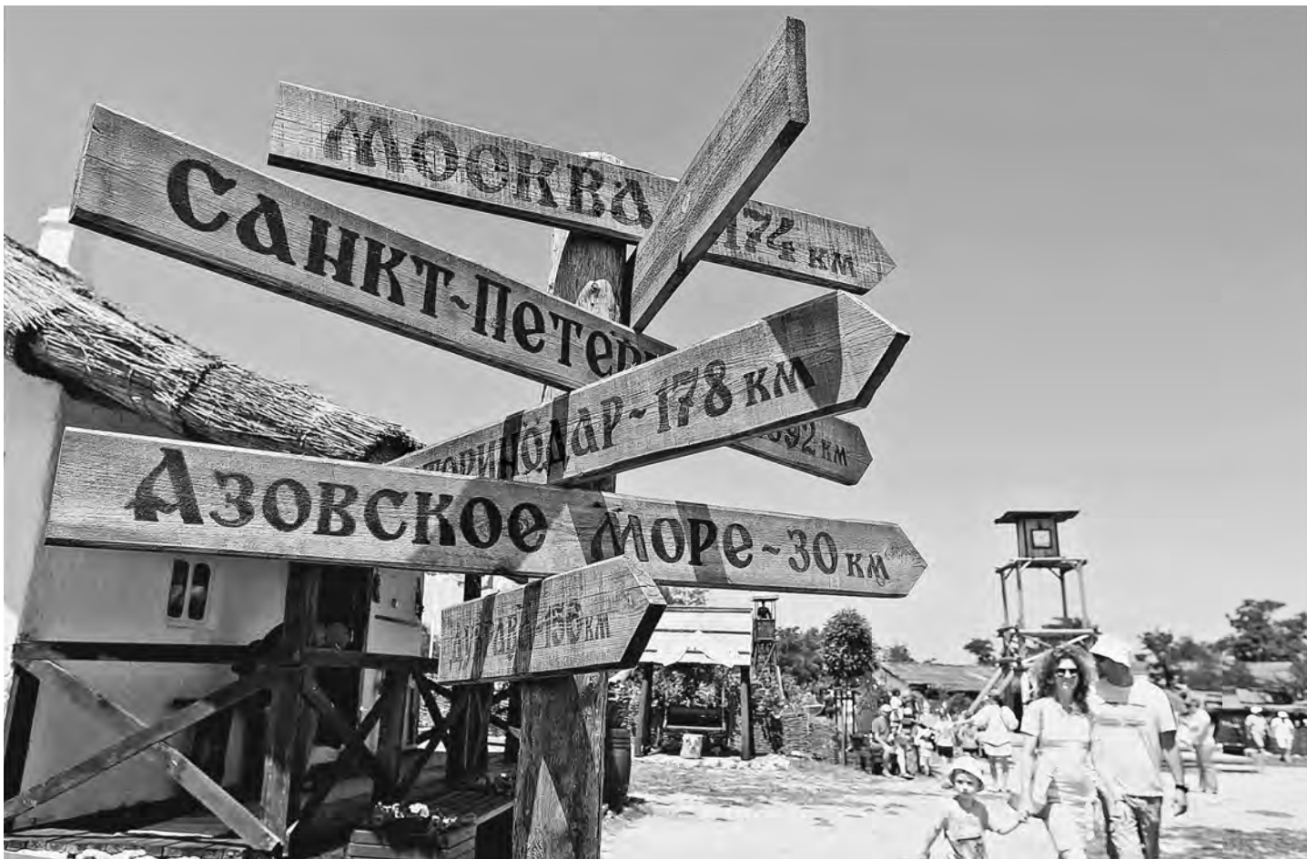
Экономики регионов смотрят в разные стороны, но в целом страна сработала лучше, чем прогнозировали эксперты.

Росстат выяснил, где в России самые низкие цены на еду и жилье, где больше всего выросли зарплаты и родилось много детей. Экономические и социальные показатели разви-