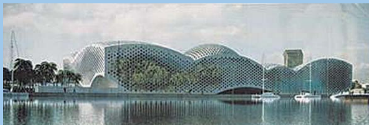
Аквариум. Поэма о море