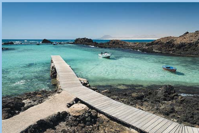
Исла де Лобос