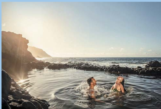
Новый год на Канарских островах