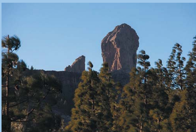
Подъем к скале Роке Нубло