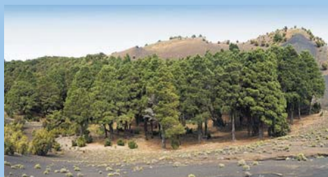
Тропа де ла Льяния