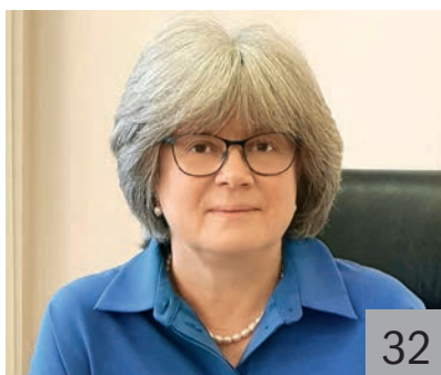
Е. Ю. УСАЧЕВА, министр финансов Архангельской области