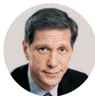
А. Д. Жуков Первый заместитель председателя Государственной думы