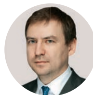
Е. А. Данчиков Министр Правительства Москвы, начальник Главного контрольного управления города Москвы