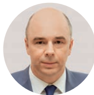
А. Г. Силуанов Министр финансов РФ