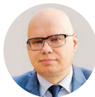
А. М. Лавров Заместитель министра финансов РФ