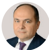
Л. В. Горнин Первый заместитель министра финансов РФ