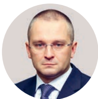
Д. В. Вольвач Заместитель министра экономического развития РФ