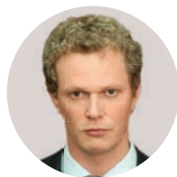
Д. В. Егоров Руководитель Федеральной налоговой службы