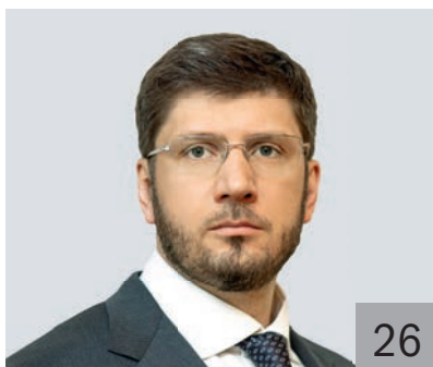
А. Н. ЛОМАКИН, первый заместитель министра строительства и ЖКХ РФ