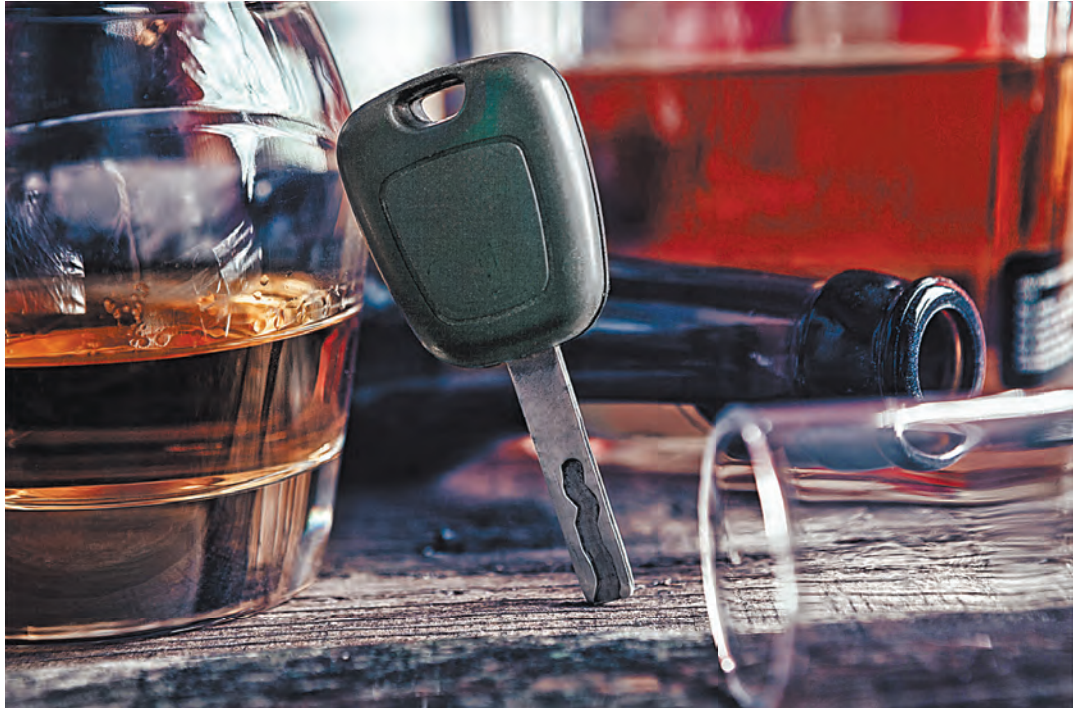
Скрываясь с места аварии, водители чаще всего стараются избежать наказания за то, что были нетрезвы.

Госдума рассмотрит 7 февраля в первом чтении проект закона, подготовленного МВД, который усилит уголовную ответственность водителей, скрывшихся с места аварии, в которой погибли или получили тяжкий вред здоровью люди. Речь идет о внесении поправок в ст. 264 Уголовного кодекса РФ и ст. 12.27 Кодекса об административных правонарушениях. Напомним, что, если водитель совершил такую аварию, ему грозит уголовная статья. Причем если медосвидетельствование показало, что водитель был во время аварии нетрезв, ему грозит более серьезное наказание: плюс два года к сроку, который он мог бы получить, если бы был трезв. При этом в случае смерти пострадавшего для нетрезвого водителя наказание будет начинаться с 2 лет заключения. Однако довольно часто води-