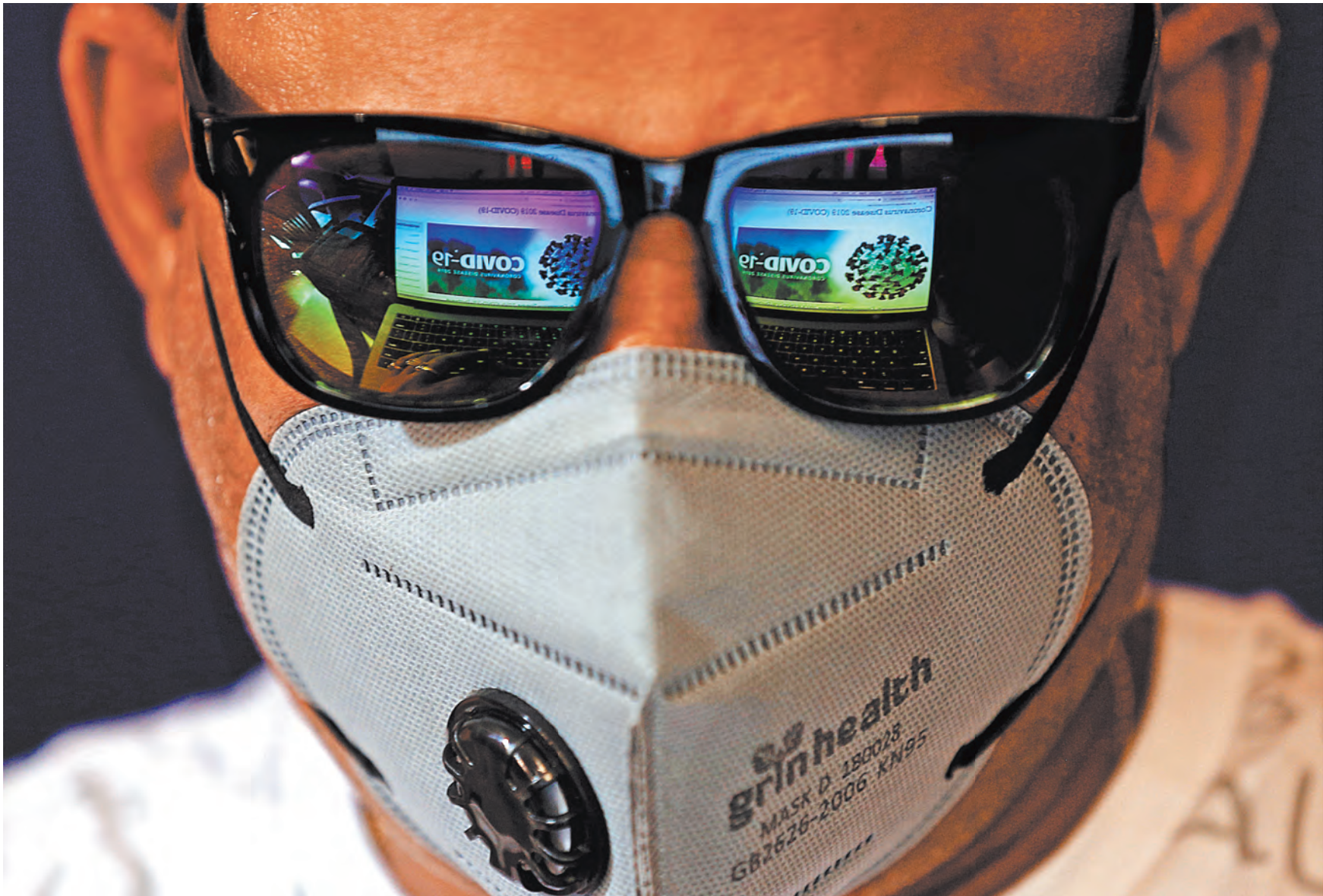
Из-за коронавируса маски стали привычным элементом офисного дресс-кода.