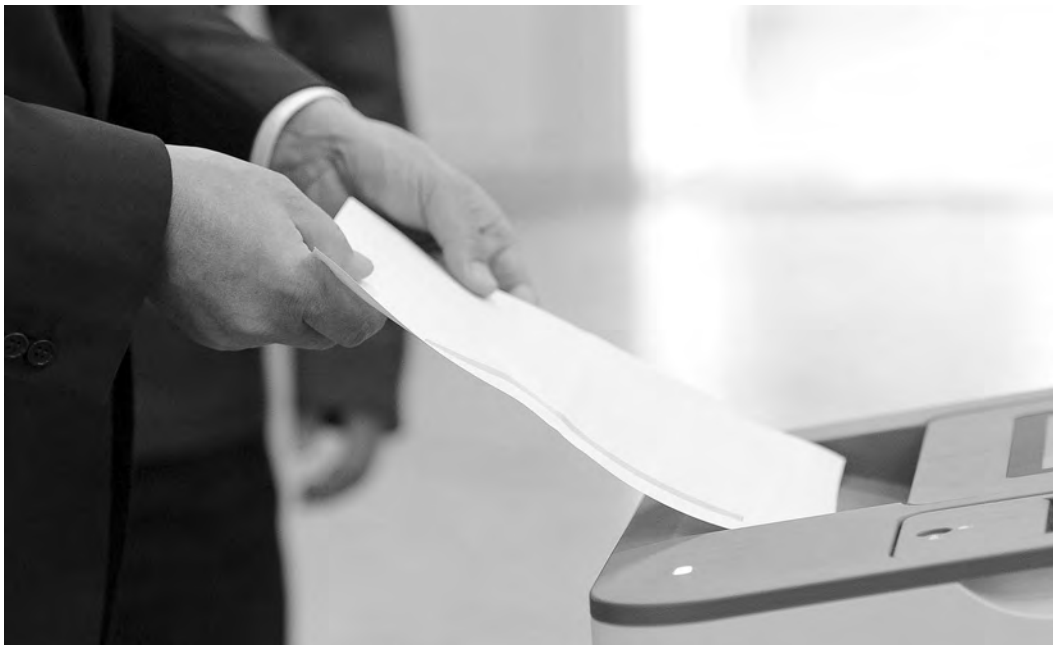
ПРЕСС-СЛУЖБА ПАРЛАМЕНТА КР

Количество претендентов на пост главы республики сократилось втрое