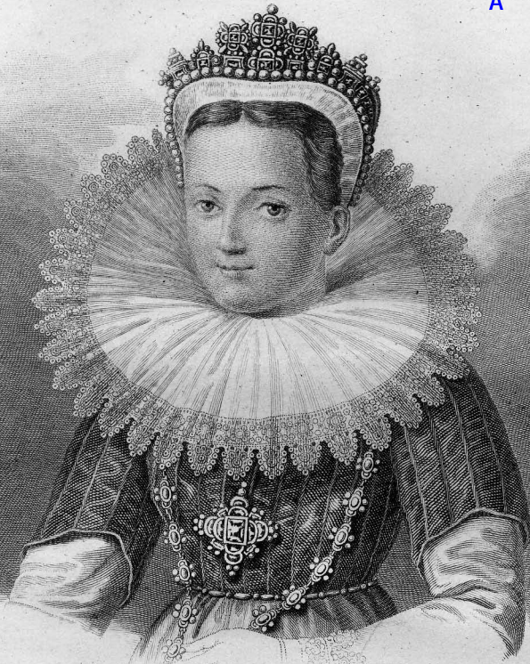
Грав. Александром Шкунковым Императрицы III. А. X. 1834 года.