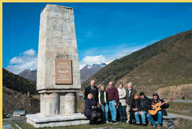
У обелиска К.Хетагурова