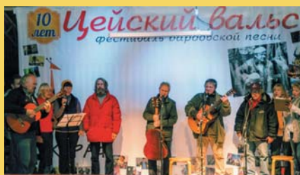
Гала-концерт Цейский вальс