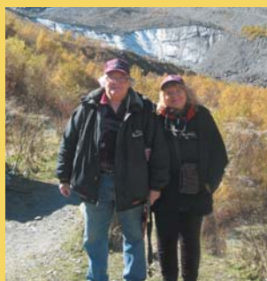
У Скаазского ледника