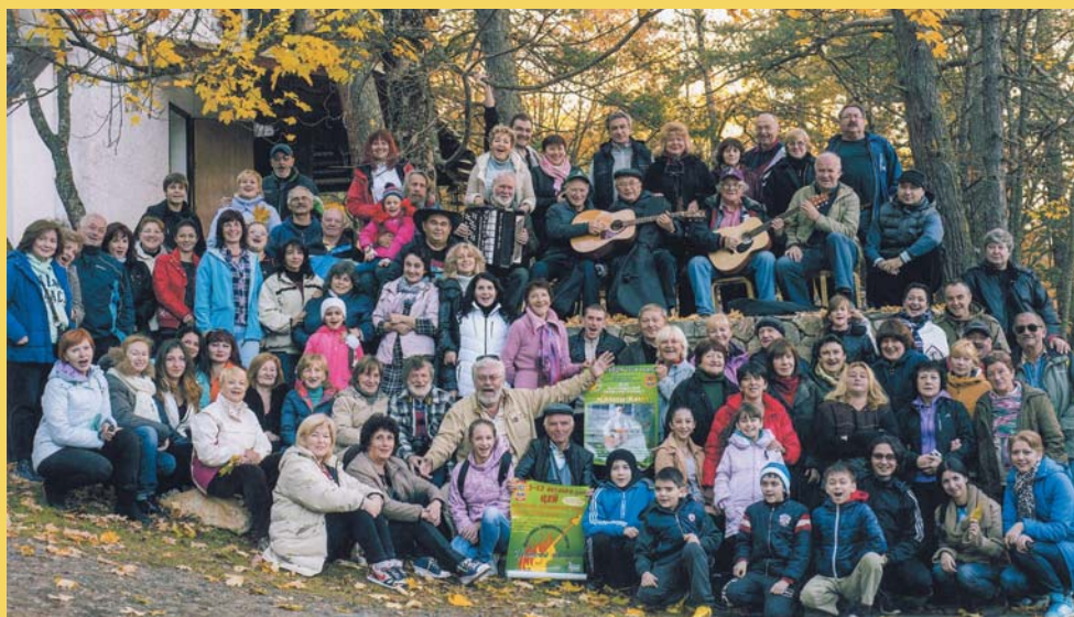
Будем помнить Цейский вальс