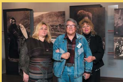
В музее К.Хетагурова