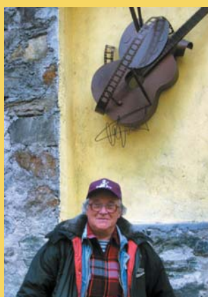
У Стены Визбора