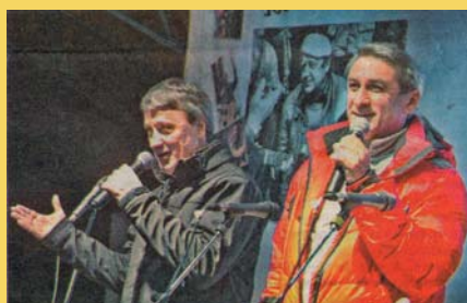
Поющие генеральные спонсоры