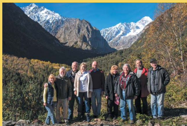
Участники концерта в Цхинвале