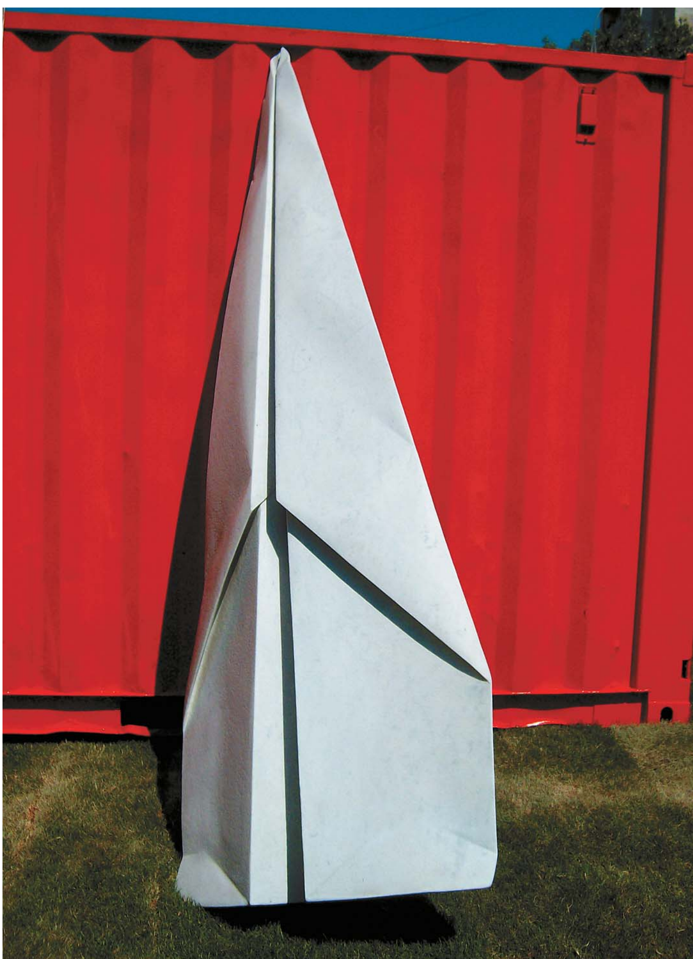
Фабио Виаде. «Самолет». Мрамор. 2007