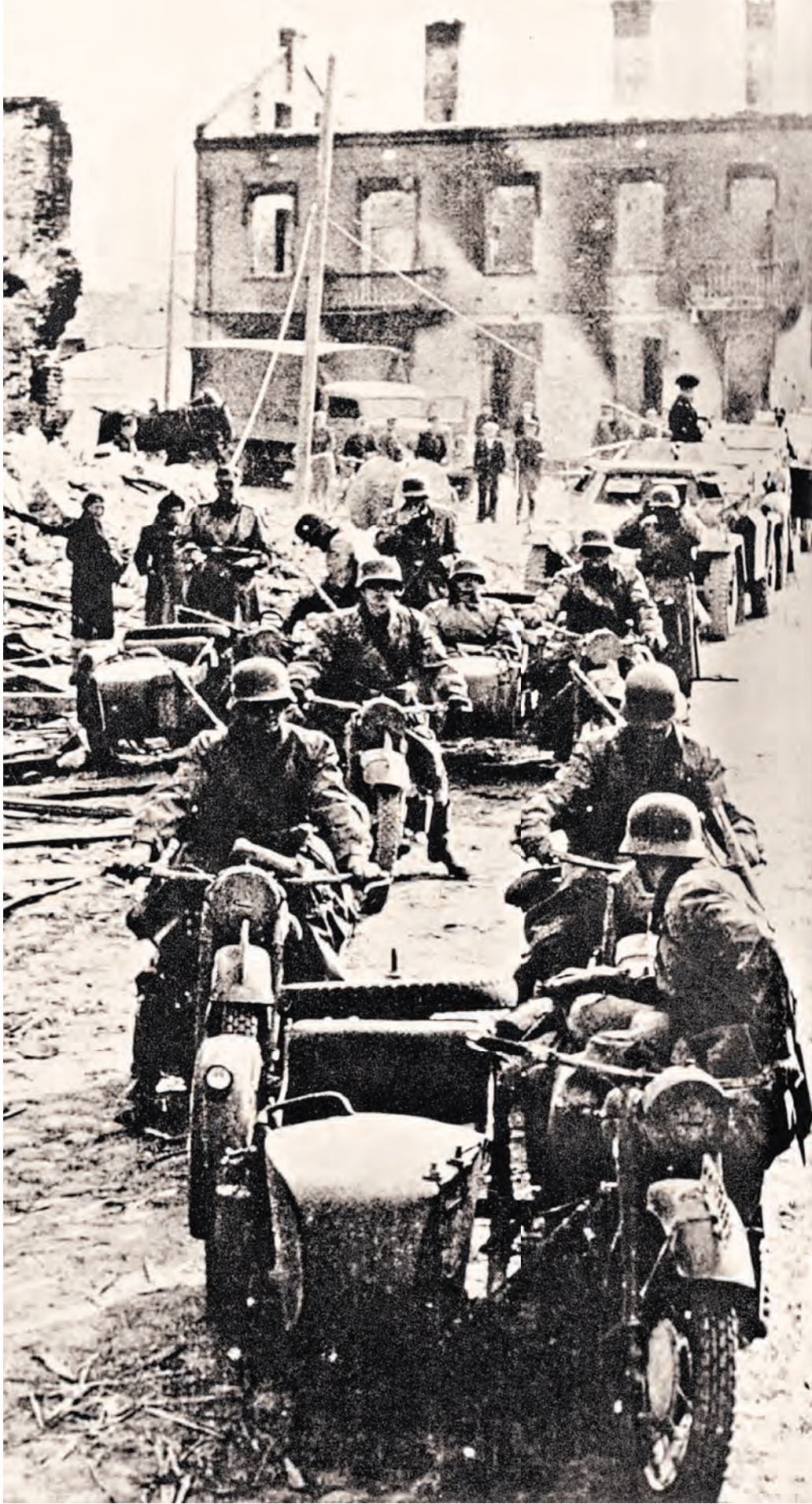
Наступление германских войск в Польше в сентябре 1939 года.