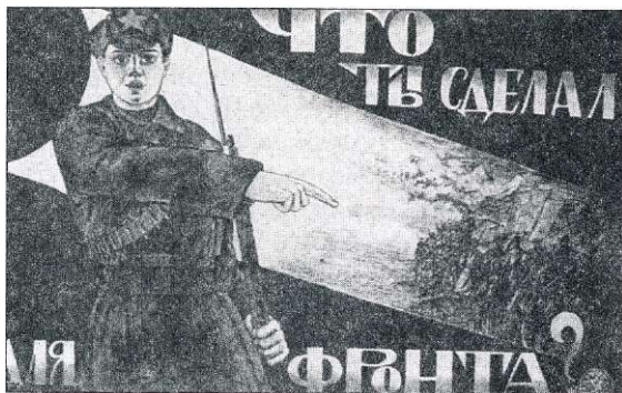
Плакат времён Великой Отечественной войны

Но этот лозунг можно было понимать и иначе, шире, чем просто и буквально - всё отдавать фронту. Частный, казалось бы, вопрос о благоустройстве города в военное время был вопросом сохранения здоровья жителей, а, значит, устойчивой работы предприятий, которые выпускали оборонную продукцию. Обеспечение чёткой работы бань, водопровода, канализации, электричества, вовремя проведённый ремонт домов, хорошее санитарное состояние города - именно это давало гарантию от эпидемий, которые являются неизбежными спутниками войн, а снабжение города топливом - гарантию от заболеваний. Так руководители города понимали свой долг перед фронтом. Ежедневное решение прозаических задач, казалось бы, очень далёких от боевых действий наших войск на полях сражений, тоже было направлено на выполнение общей большой цели - сделать всё возможное для победы, на каком бы участке ни протекала деятельность людей, в том числе - облечённых властью. В непростое время городские власти сумели мобилизовать все силы жителей города на труд во имя Победы.